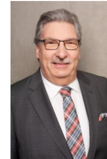
Bild: Präsident des Abgeordnetenhauses von Berlin Herr Ralf Wieland