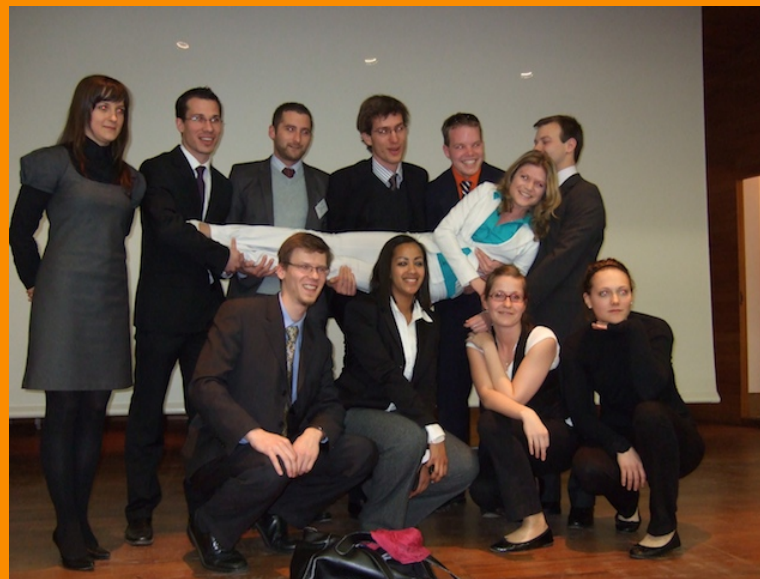
Die Deutsche Delegation 2009

Darüber hinaus arbeitet der Verein daran, weitere Projekte und Gipfel-Simulationen zu fördern. So wurde im November letzten Jahres, in Kooperation mit dem Potsdam Institut für Klimafolgenforschung (PIK), der Model-COP15, eine Simulation der Kopenhagener Klimaverhandlungen, erfolgreich durchgeführt.