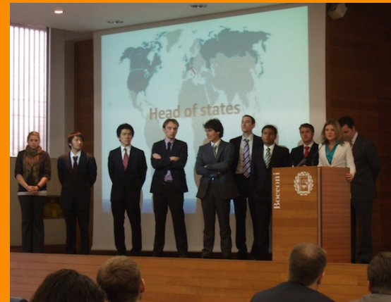
Die Heads of State 2009

Im Gegensatz zu reinen Simulationen wie zum Beispiel Model United Nations, geht es beim G8/G20 Youth Summit nicht um eine reine Wiedergabe nationaler Positionen, sondern um konkrete Lösungsansätze mit innovativem Charakter. So entwickelten zum Beispiel die Heads of State 2009 einen neuartigen Ansatz zur Reform des Sicherheitsrates der UN. Die Delegation bestimmt dabei gemeinsam die Linie für die Verhandlungen und vertritt somit die Stimme ihrer Generation zu den aktuellen politischen Themen. Das eigene Land und seine Interessen immer im Blick, dennoch mit dem Bewusstsein für nachhaltiges Handeln in der Verantwortung anderen Generationen und Völkern gegenüber.